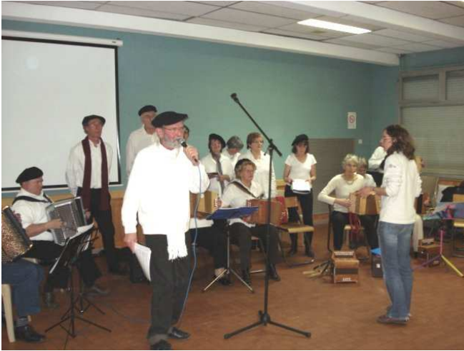
Les « vœux » à BRETEIL